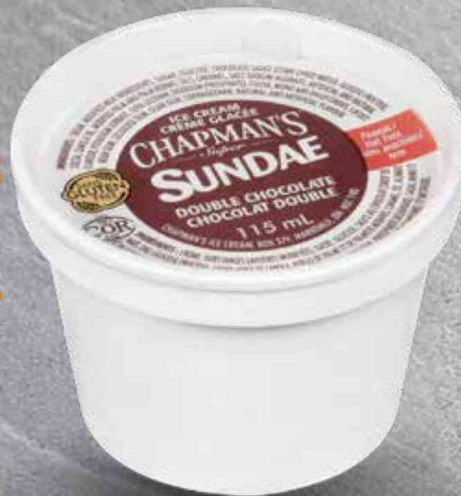
ICE CREAM CUP