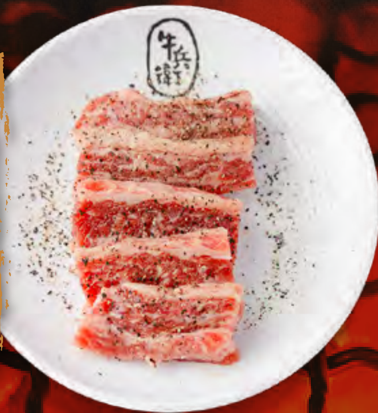
BLACK PEPPER KALBI