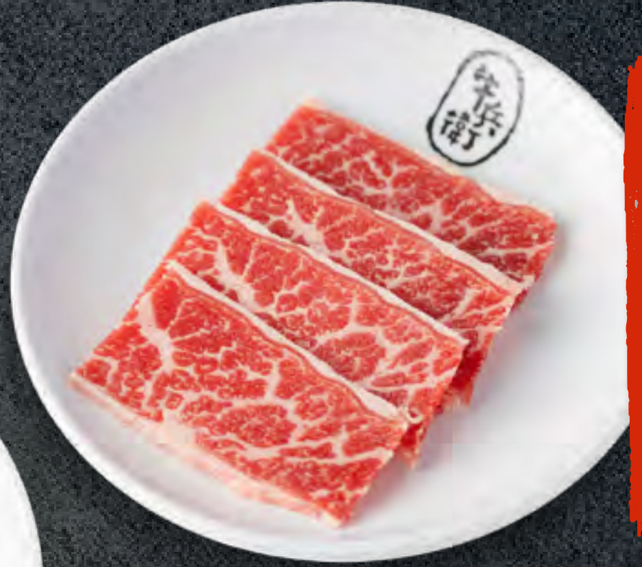
MISO MARINATED STEAK