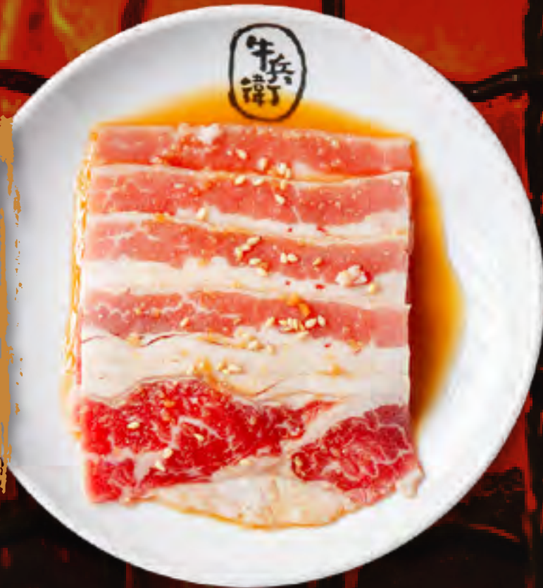
SWEET SOY BEEF BRISKET