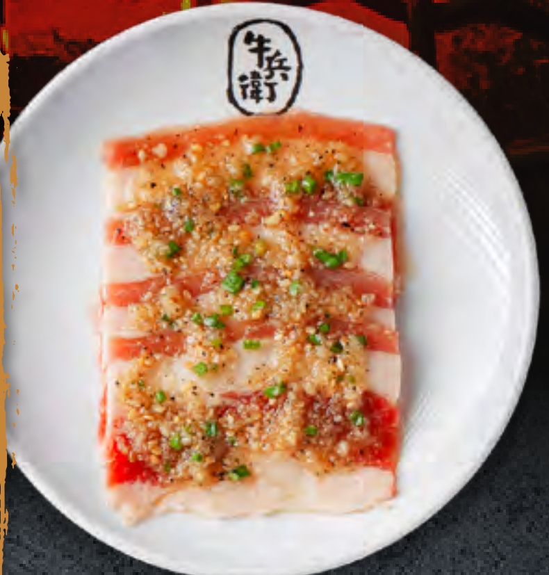
GARLIC BEEF BRISKET