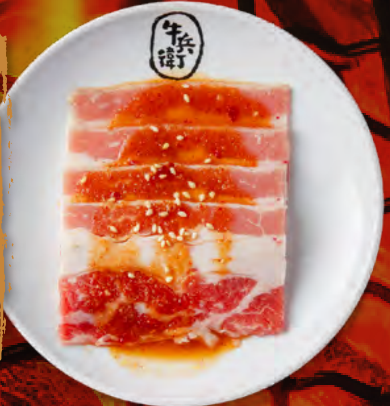
MISO BEEF BRISKET