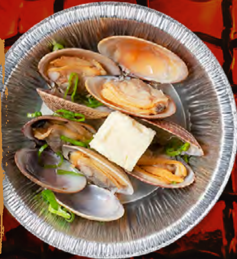
SAKE STEAMED CLAM