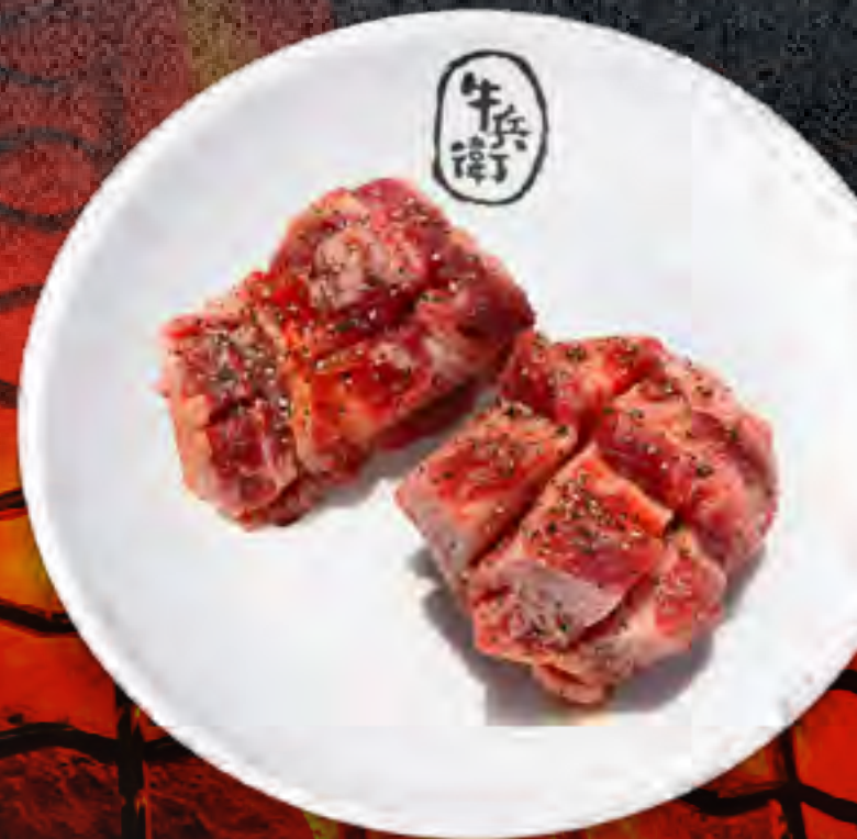
MISO MARINATED STEAK .....