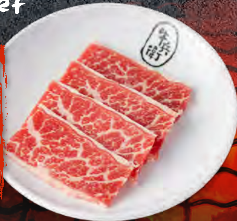
PRIME KALBI .....