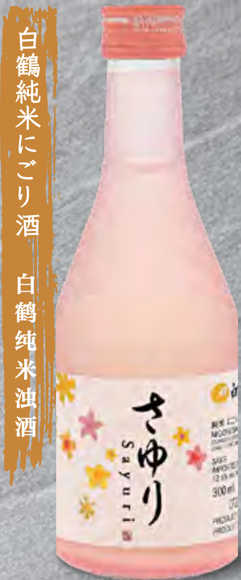
白鶴純米にがり酒 白鶴純米濁酒