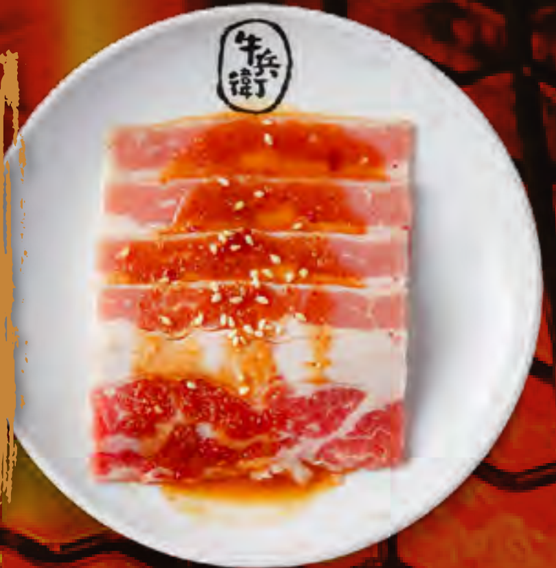
BLACK PEPPER KALBI