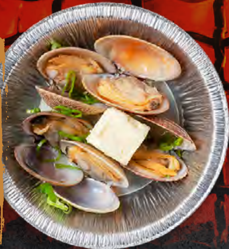
SAKE STEAMED CLAM