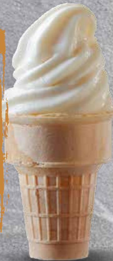
ICE CREAM CONE (Limit 1 per person) Please call our server to order.