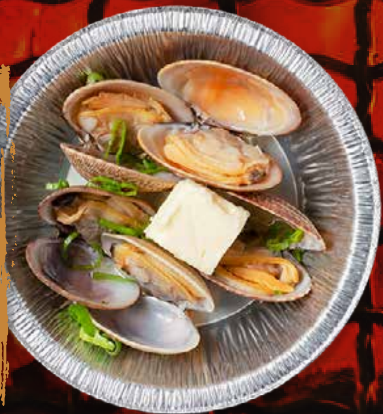
SAKE STEAMED CLAM