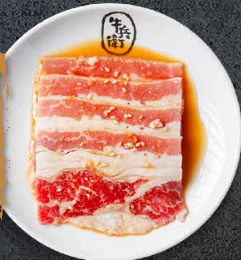
SWEET SOY BEEF BRISKET