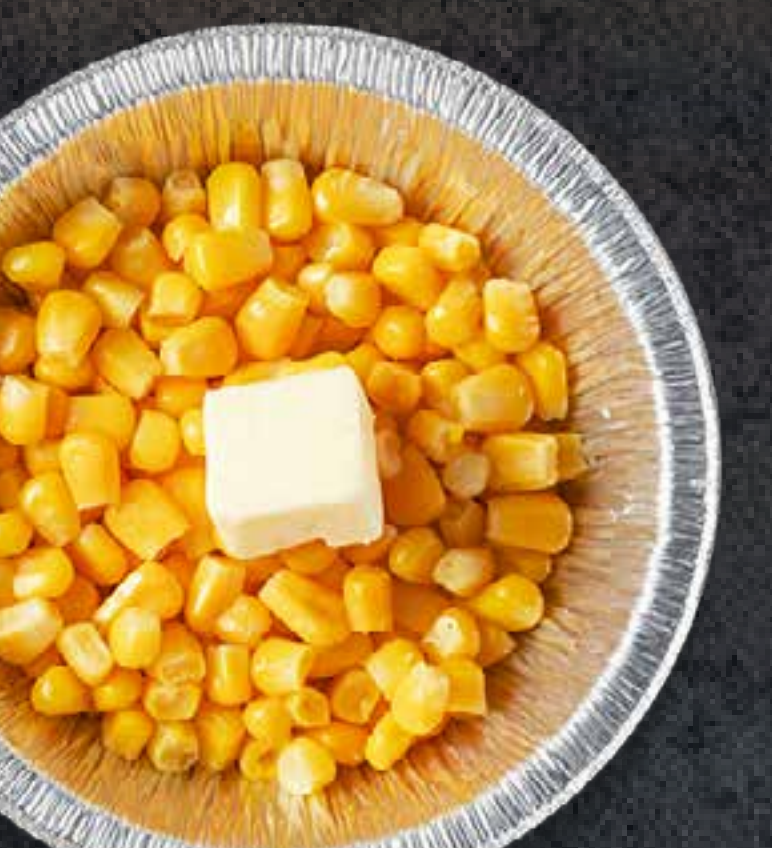
BUTTER CORN (IN FOIL)