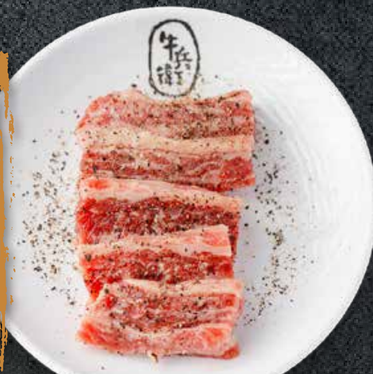
BLACK PEPPER KALBI