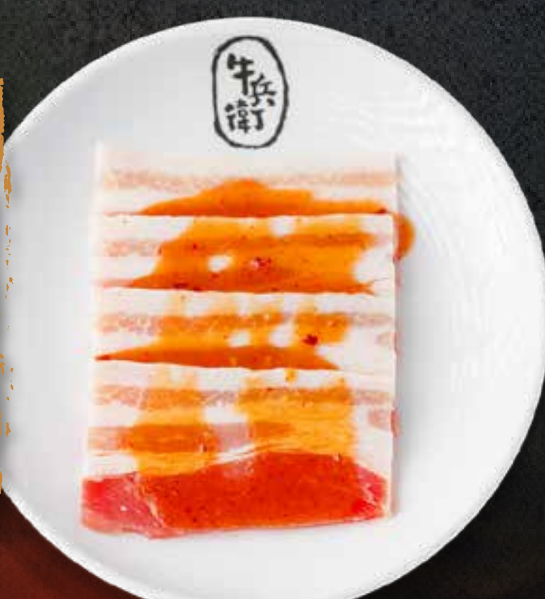
MISO PORK BELLY