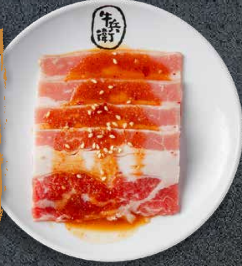
MISO BEEF BRISKET