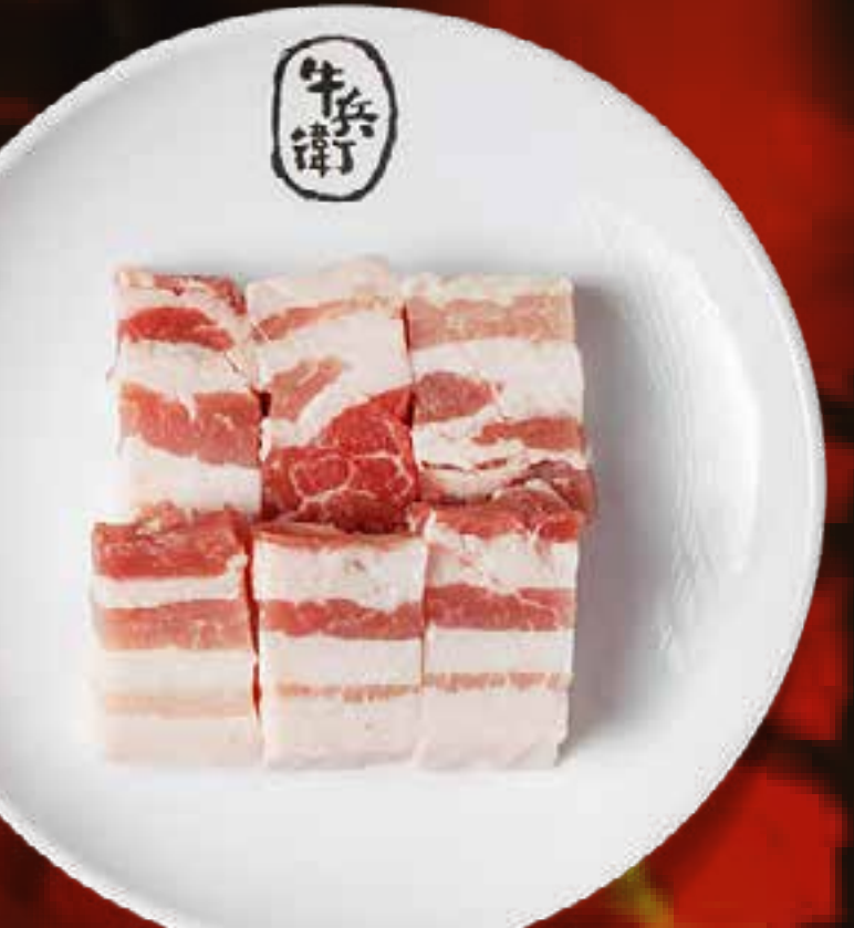
PORK BELLY (THICK CUT)