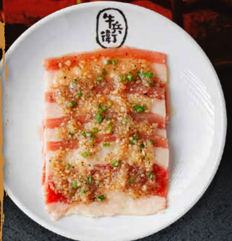
GARLIC BEEF BRISKET