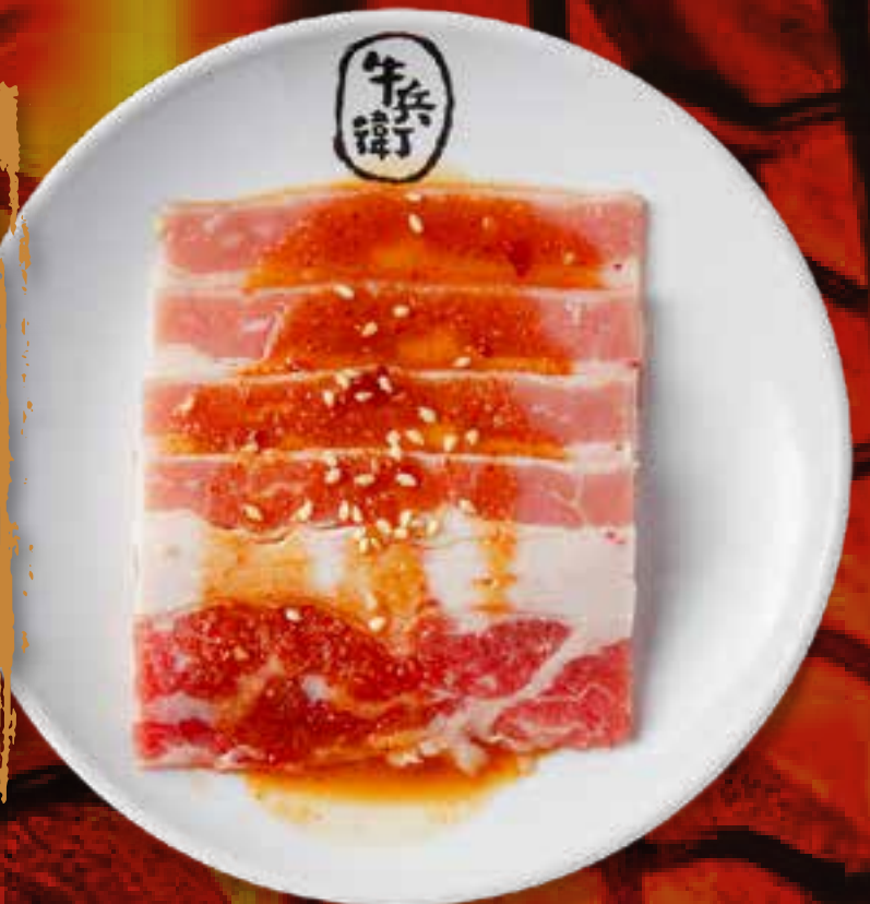
MISO BEEF BRISKET