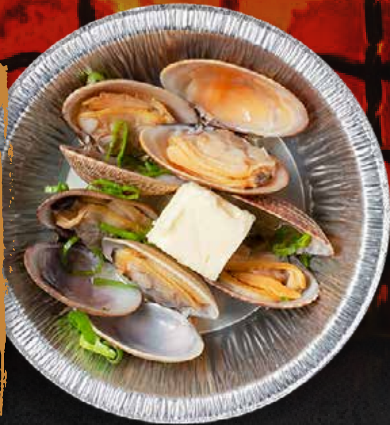
SAKE STEAMED CLAM