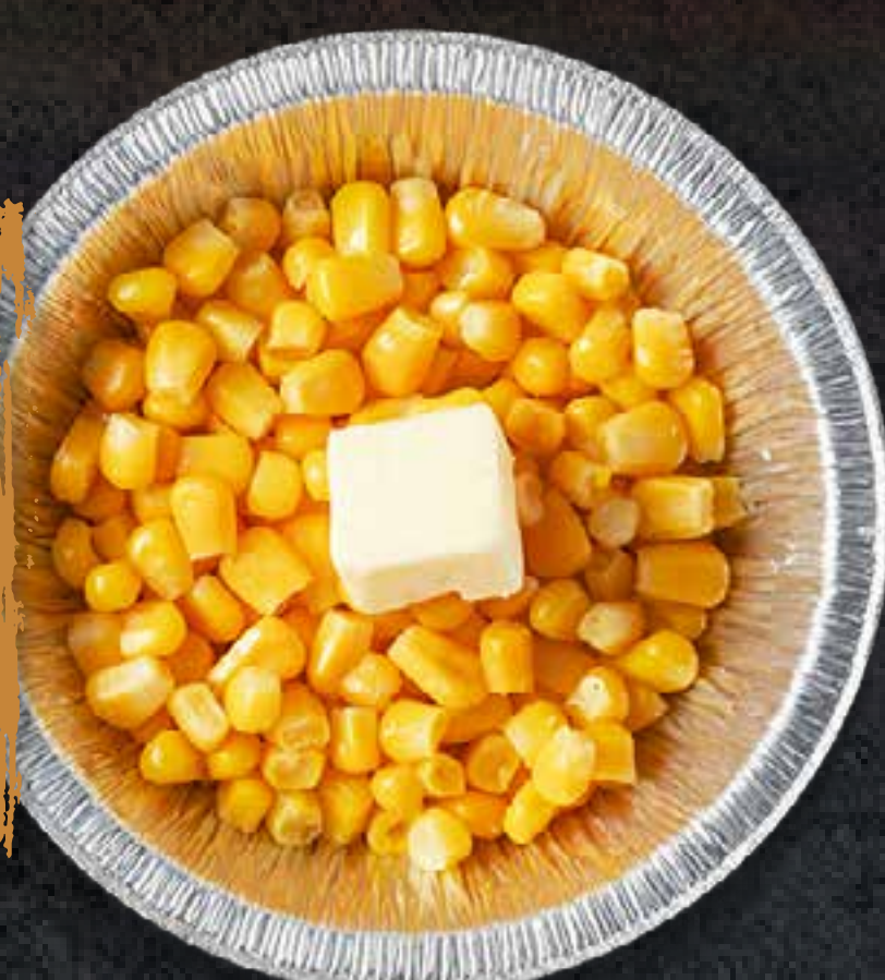
BUTTER CORN (IN FOIL)