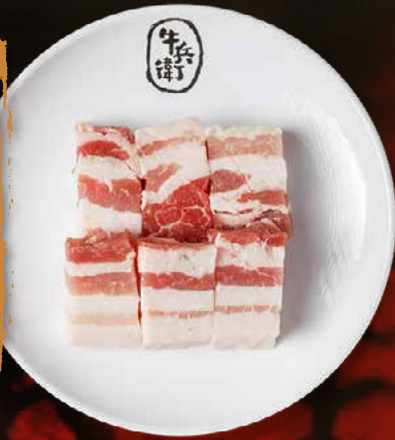
PORK BELLY (THICK CUT)