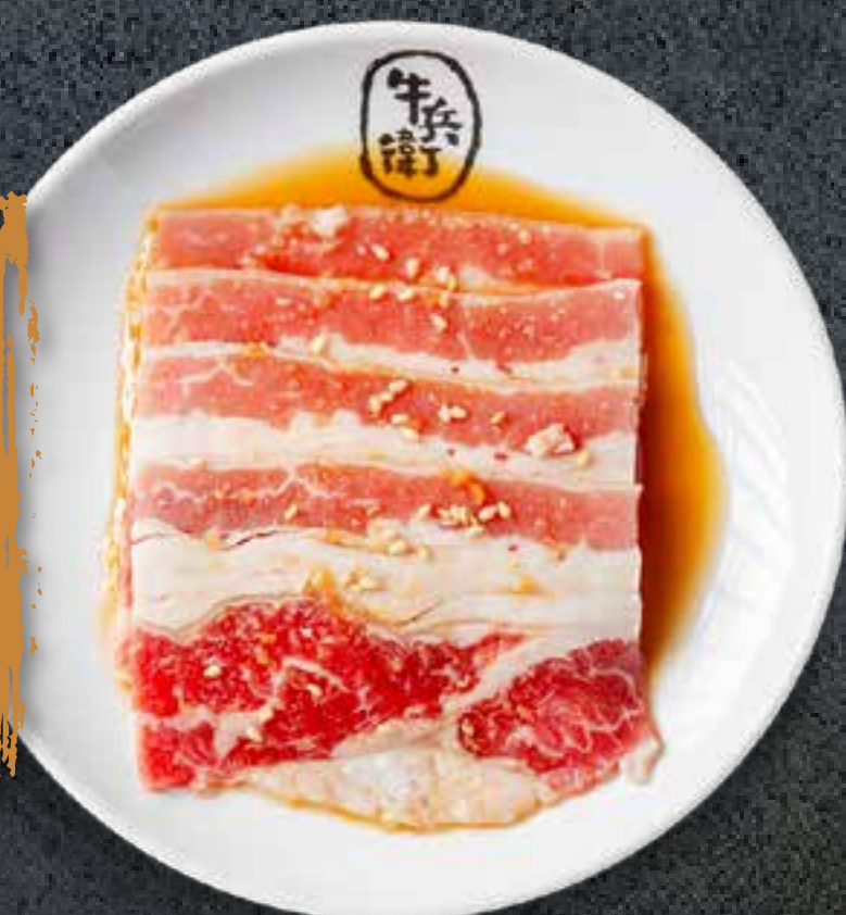
SWEET SOY BEEF BRISKET