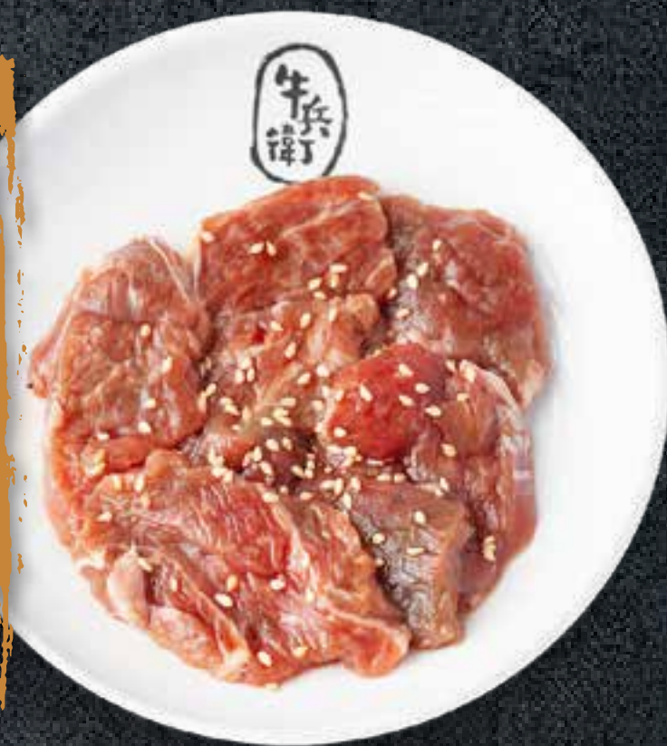
SWEET SOY MARINATED SHORT RIB